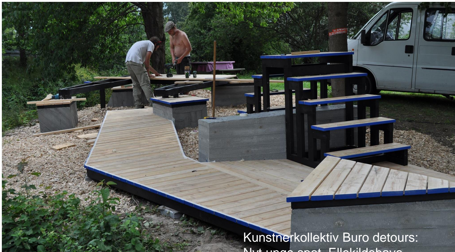
Kunstnerkollektiv Buro detours: Nyt unge spot, Ellekildehave