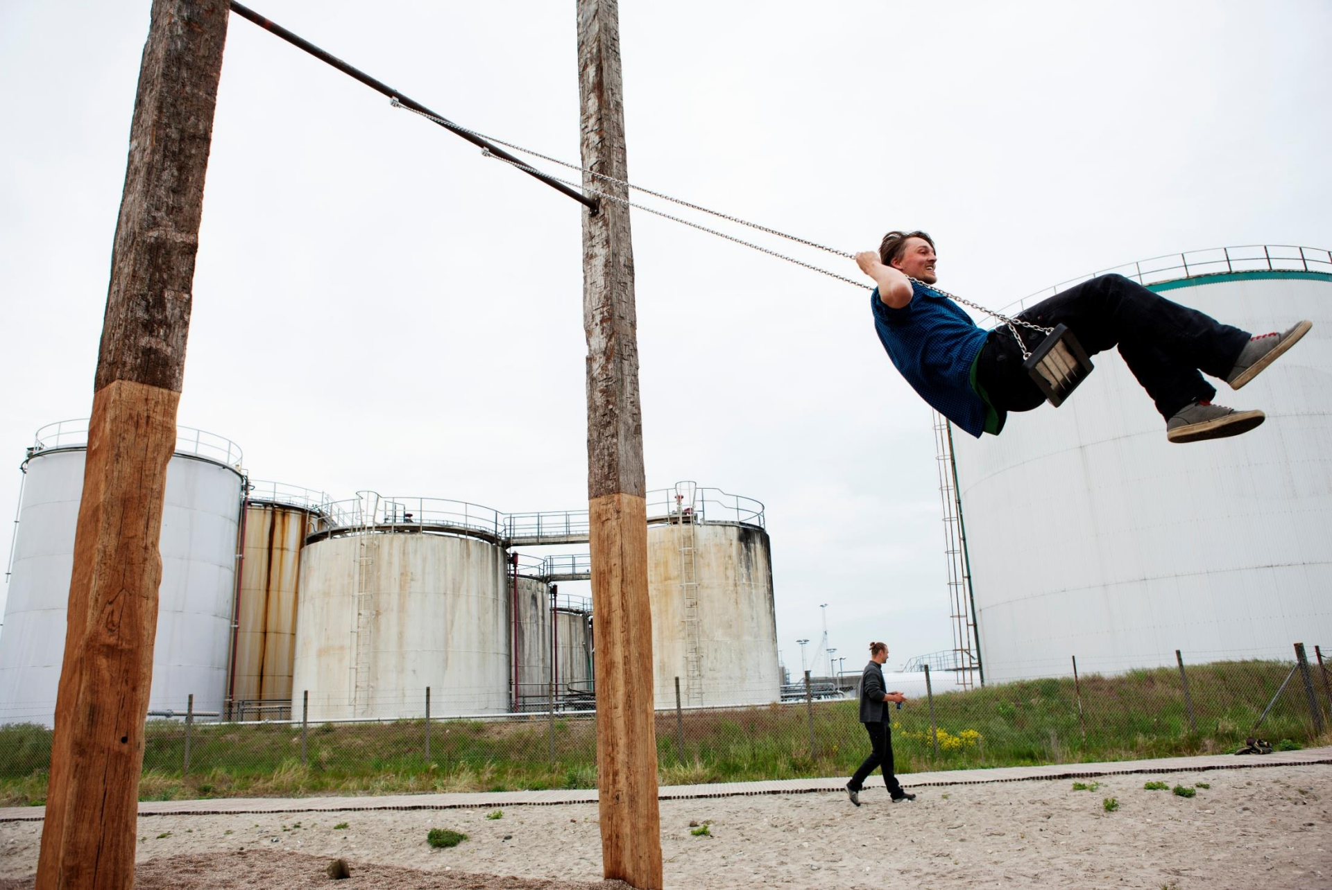
Urban Play udstilling, mellem by og landskab. Rauamlabor, Berlin